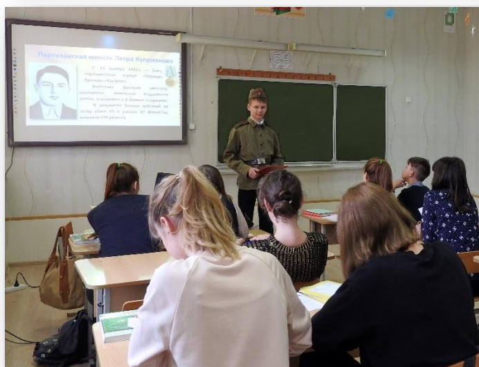
Лекция «Пример мужества»

Кроме экскурсий, мы проводим лекции, слушая которые ребята знакомятся с событиями минувших дней и вспоминают земляка-героя.