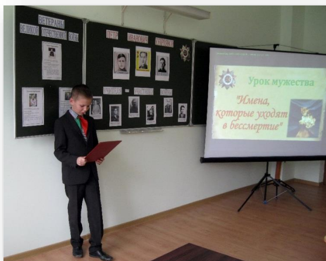
Урок мужества «Имена, которые уходят в бессмертие»

На протяжении года во всех классах проводятся уроки мужества, устные журналы, часы памяти, посвященные Петру Куприянову.