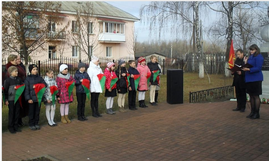
Прием в пионеры

Такие мероприятия как приём в октябрята, пионеры и в члены БРСМ очень часто проходят в музее или возле бюста П. Куприянову, т.к. создаваемая таким образом атмосфера содействует более глубокому осознанию важности подобных событий.