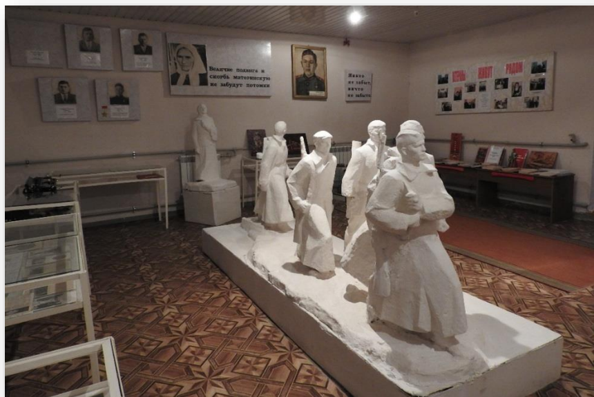
Макет монумента в честь советской матери-патриотки

Центральное место в нашем музее занимает макет монумента в честь советской матери-патриотки А.Ф. Куприяновой и её сыновей, которые сражались на фронтах Великой Отечественной войны. Макет был подарен школе в 1975 году авторами проекта. Впоследствии он был передан городскому краеведческому музею, а позднее вновь возвращен школе. Но в тот момент макет монумента уже требовал серьезной реконструкции. К 2012 году силами педагогов и учащихся школы он был полностью восстановлен.