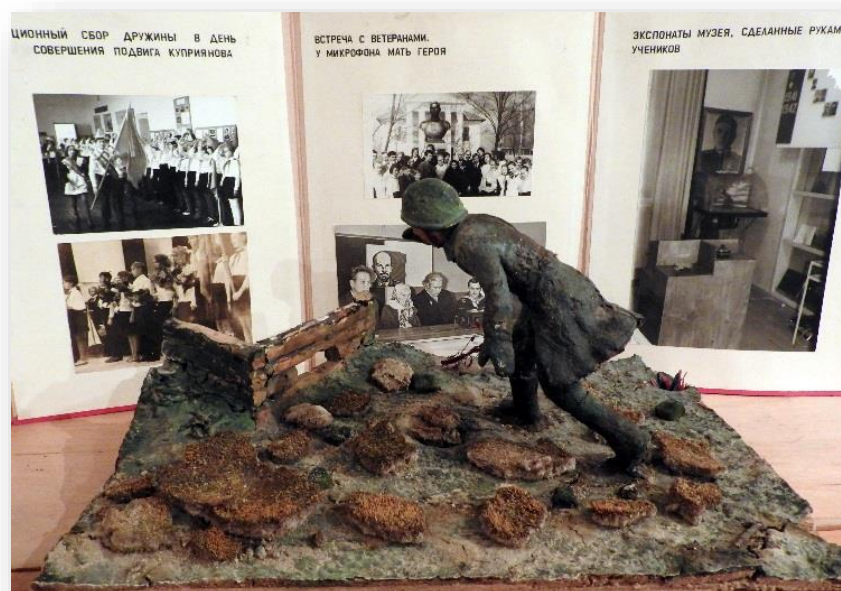
Макет подвига П.И. Куприянова, созданный учащимися школы

Петр Куприянов укрылся в воронке от взрыва недалеко от дзота. Внезапно он поднялся, подбежал к дзоту и упал грудью на амбразуру. Пулемёт замолчал. Батальон бросился в атаку. Высота была взята.